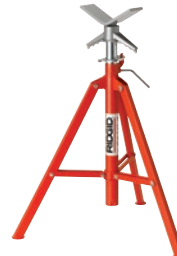
Опоры для труб с V-образными головками