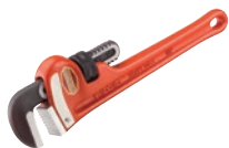
Прямые ключи для больших нагрузок