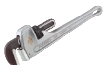
Прямые алюминиевые ключи